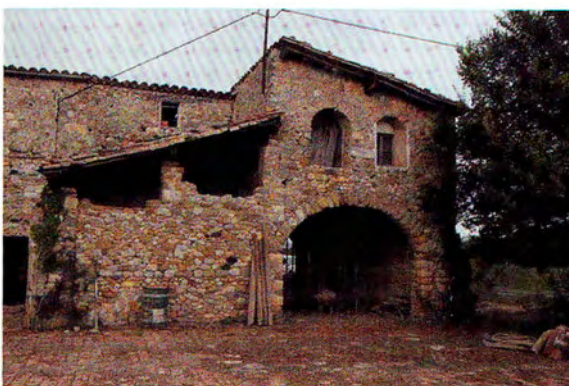
Figura 3. Masia a Dosquers.

Arribats a aquest punt de l'article, cal puntualitzar que existeix una gran diversitat de catàlegs de masies en vigor i molts han donat respostes complexes i madures a aquestes reflexions aquí plantejades, com és el cas de les condicions dels forats de les façanes. Així, requisits establerts en antigues normatives que manifestaven la necessitat de prioritzar els plens sobre els buits amb un criteri reduccionista, ja preveuen l'existència de porxades i galeries tradicionals que no segueixen aquesta regla (figura 3). Però encara falta completar la feina.