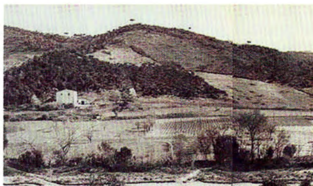
Figura 1. Paisatge rural de Dosrius al anys cinquanta del segle XX.

Amb l'avenç de la modernitat, és a dir, a la tardomodernitat, processos homogeneïtzadors i deshumanitzadors van començar a unificar qualsevol construcció sense que importés el territori al qual estava vinculat. I, tal com prediuen les lleis de la mecànica, tota acció té una reacció. Això, al nostre cas, va portar a l'exaltació dels paisatges preindustrials, és a dir, el camp i els seus paisatges rurals. Aquests espais varen agafar el paper de signes identitaris encara amb més força que fins al moment havien tingut. La masia intensifica el paper d'una realitat física que representa la institució al voltant de la qual girava l'organització social del món rural, aquell món que la modernitat estava esborrant (figura 1). I, per tant, en paral·lel, també va anar creixent un sentiment de protecció vers aquells rastres d'un passat propi i particular. És la mateixa organització impersonal creada a la modernitat l'encarregada de vetllar per la seva conservació i evitar-ne la transformació accelerada i sobtada.